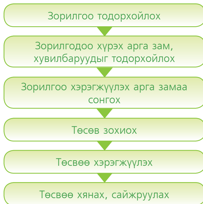
Зураг 1.5. Өрхийн төсөв зохиох үе шат

Энэ үйл явцад хамгийн чухал нь өрхийн гишүүн бүр тооцоотой байх хандлагын болоод үйлийн өөрчлөлт бий болгож байвал үр дүн харагдана.