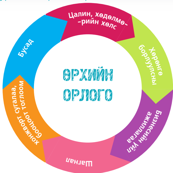
Зураг 1.2. Өрхийн орлогын ангилал

Өрхийн орлогыг олон шинжээр ангилж болох бөгөөд Зураг 1.2-т үзүүлсэн ангилал нь ХХОАТ-ын зорилгоор ангилсан ангилал юм. Үүнээс гадна жил бүр МУ-ын ҮСХ-ноос өрхийн сарын дундаж орлогын бүтцийг тодорхойлон гаргадаг. Үүнийг Зураг 1.3-аас харна уу.