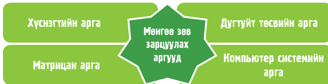
Зураг 1.6. Өрхийн төсөв зохиох аргачлал

Өрхийн төсөв зохиох хэд хэдэн арга байдаг бөгөөд Зураг 2.6-д өргөн ашигладаг, нийтлэг аргуудыг харууллаа.