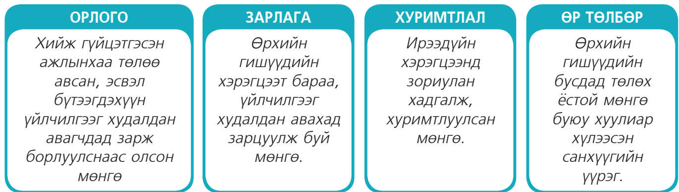
Зураг 1.1. Өрхийн төсвийн үндсэн ойлголтууд

Гэр бүлийн гишүүдийн нас, хүйс, боловсрол, эрхэлж буй ажил, мэргэжил зэргээс хамаараад өрхийн орлого харилцан адилгүй эх үүсвэрээс бүрддэг. Зарим өрхийн орлого зөвхөн цалин,