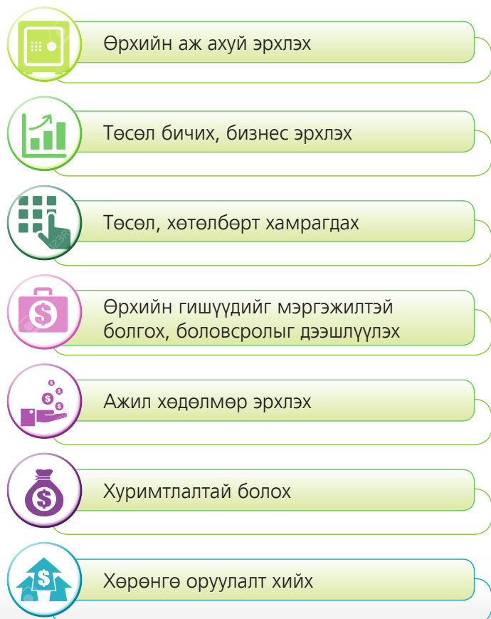
Зураг 1.4. Өрхийн орлого нэмэгдүүлэх боломж

Манай улсын нийт өрхийн сарын орлогыг ангилж үзэхэд тал хувь нь сарын 700000 төгрөгөөс бага орлоготой байгаа бол 13 хувь нь тэднээс 2-3 дахин их орлоготой байна. Олохоосоо илүү ухаалаг зарцуулалт хийх нь санхүүгийн хүнд байдлаас гарах гарц байх болно. Иймээс өрхийн төсөв зохиоход зардлын төсөв чухал ач холбогдолтой. Зардлаа төлөвлөхдөө мөнгөө хэрэгцээт зүйлд зарцуулах, мөнгө хэмнэх боломжуудыг ашиглахад анхаарах хэрэгтэй.